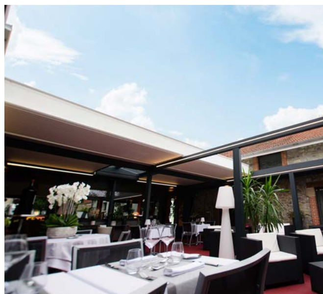
Lames en position rétractées, elles laissent une ouverture intégrale pour profiter d'une terrasse à ciel ouvert. Le Cheverny.