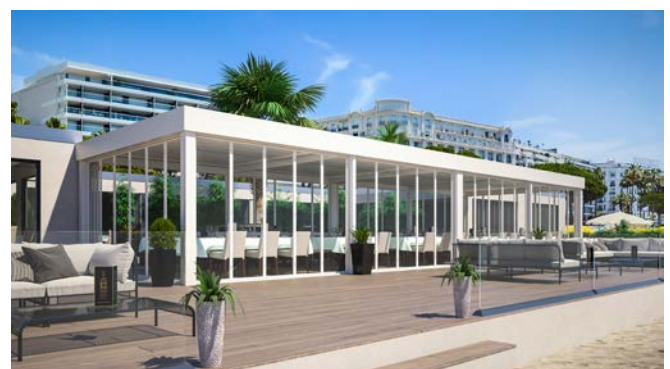
CIEL OUV'AIR® à mi-chemin entre l'indoor et l'outdoor.