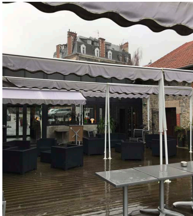
L'ancienne terrasse en bois du Cheverny ne pouvant être exploitée qu'aux beaux jours.

Entièrement modulable, elle peut être équipée de menuiseries isolées. Ses lames motorisées sont rétractables jusqu'à offrir une ouverture de la toiture à 85 %.