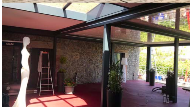
Installation de la pergola bio-thermique CIEL OUV'AIR® sur la terrasse du Cheverny.