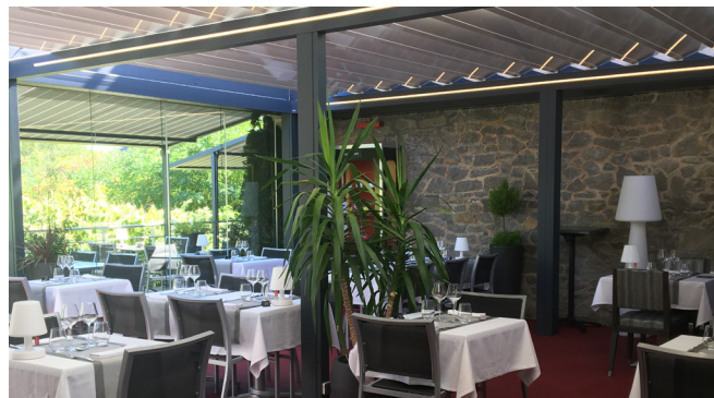
Lames en position ventilées. Le Cheverny.

Du côté des restaurateurs, le gain n'est pas seulement populaire mais surtout productif. Pour les 22 collaborateurs qui travaillent au Cheverny, CIEL OUV'AIR® rend le travail en terrasse beaucoup plus simple et moins pénible.