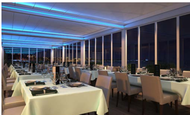
CIEL OUV'AIR® lames en position fermées.