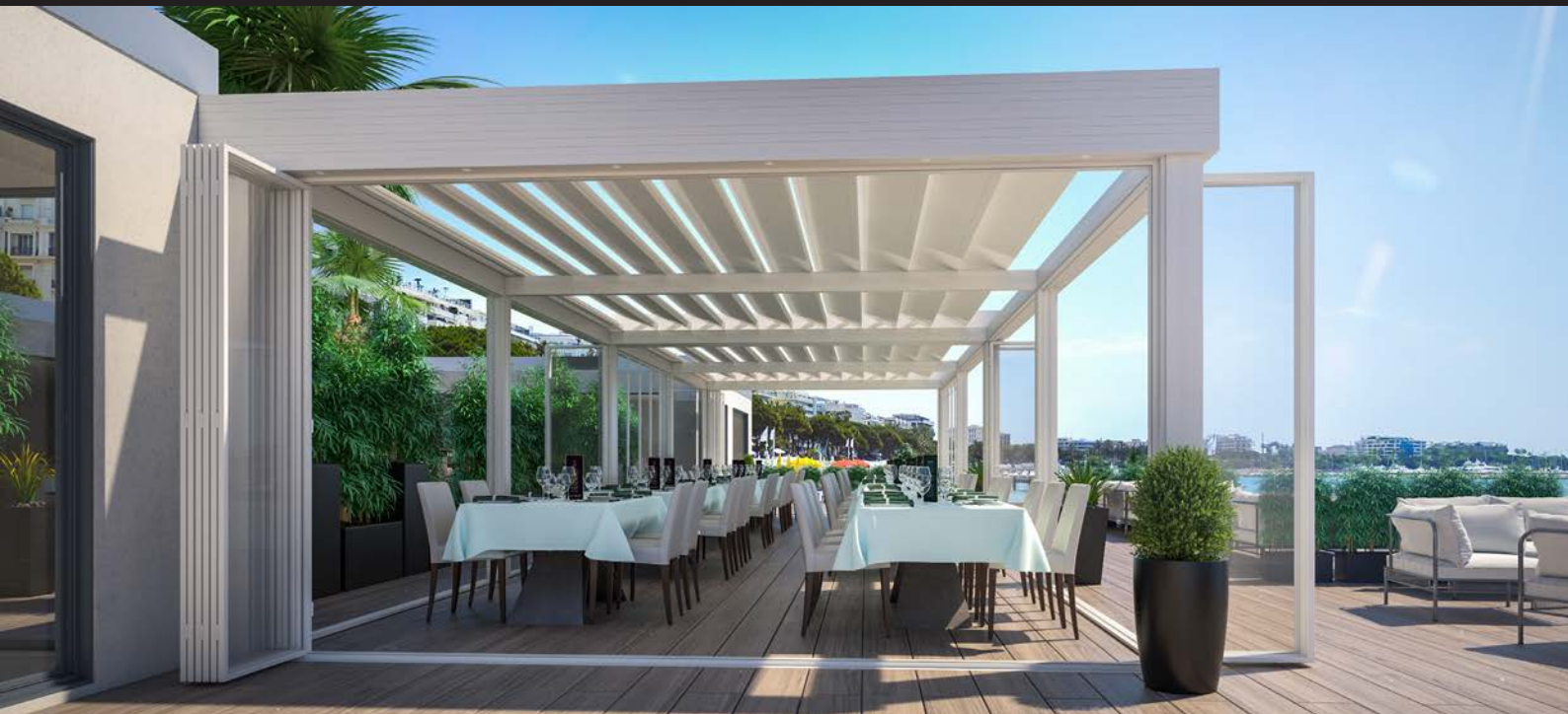
CIEL OUV'AIR® restaurant bord de mer.