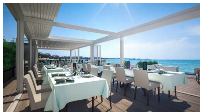
Pergola bio-thermique CIEL OUV'AIR® en bord de mer.

La pergola bio-thermique CIEL OUV'AIR® offre aux clients du restaurant Le Cheverny un espace de restauration élégant et confortable.